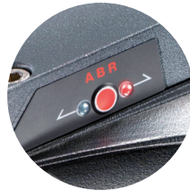
ABR Advanced Balancing Recorder