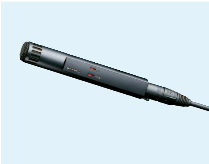
Das abgebildete Kabel gehört nicht zum Lieferumfang.

Das Nierenmikrofon MKH 40 ist vielseitig einsetzbar, z.B. als Hauptmikrofon, besonders in leicht halligen oder akustisch weniger perfekten Räumen, oder zur Aufnahme von Instrumentengruppen, Solisten und Sprechern. Die in einem weiten Winkelbereich neutrale Richtcharakteristik und die hohe Rückwärtsdämpfung sorgen für eine gute klangliche Balance.